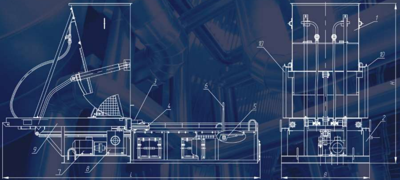
Рис. 1. Топка механическая с шурующей планкой ТШПм. 1. Бункер; 2. Рама; 3. Шурующая планка; 4. Полотно колосниковое; 5. Опрокидывающиеся колосники; 6. Механизм опрокидывания; 7. Электропривод; 8. Редуктор; 9. Рама каретки; 10. Ограждение.